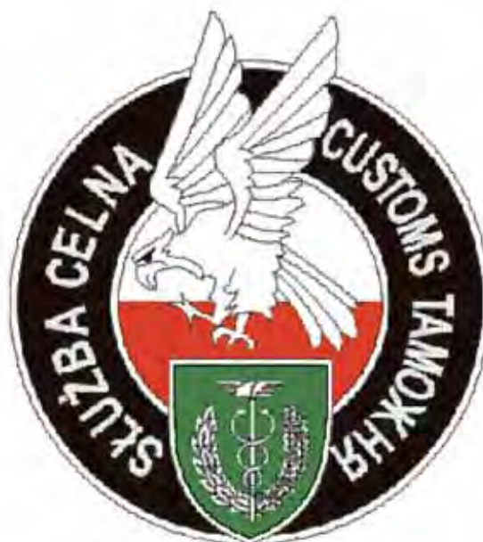
Emblemat funkcjonariuszy komórek organizacyjnych właściwych w sprawach zwalczania przestępczości