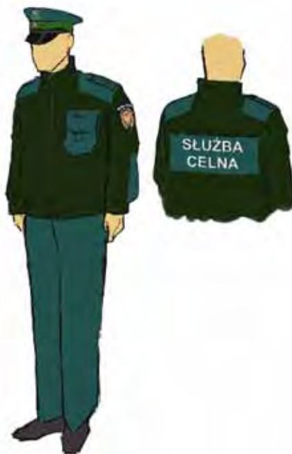
Funkcjonariusz w ubiorze służbowym, ubrany w sweter typu polar z obszyciem.