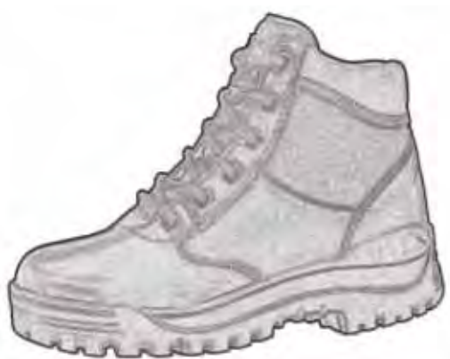
Buty letnie na grubej podeszwie.

Funkcjonariusz będący członkiem załogi jednostki pływającej w ubiorze koloru ciemnoniebieskiego, ubrany w spodnie typu bermudy, koszulobluzę z krótkim rękawem, czapkę polową letnią, buty letnie na grubej podeszwie.