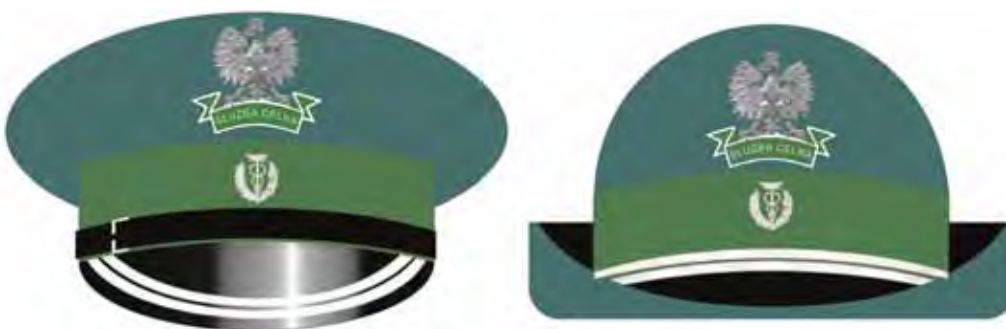
inspektor celny młodszy inspektor celny podinspektor celny