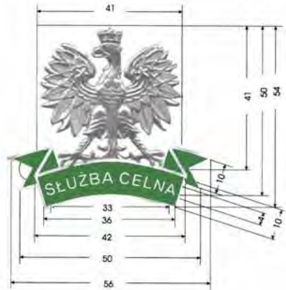
Wizerunek orla ze wstęgą z napisem „SŁUŻBA CELNA” noszony na umundurowaniu funkcjonariuszy