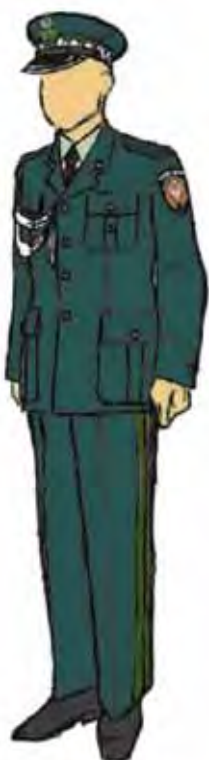
Funkcjonariusz w stopniu generała Służby Celnej oraz nadinspektora celnego w ubiorze służbowym, ubrany w spodnie z lamпасami, koszulę w kolorze białym i marynarkę ze sznurem galowym.