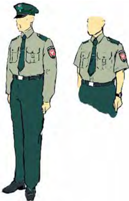
Funkcjonariusz mężczyzna w ubiorze służbowym.