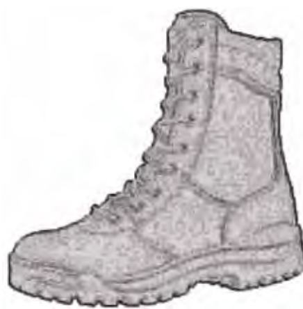
Buty wysokie na grubej podeszwie.