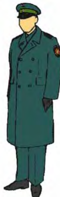
Funkcjonariusz w ubiorze służbowym, ubrany w płaszcz.