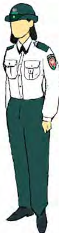
Funkcjonariusz kobieta w ubiorze służbowym.