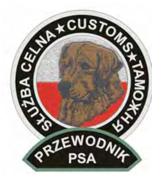
Emblemat funkcjonariuszy – przewodników psów służbowych