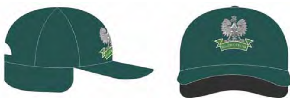
Czapka polowa zimowa koloru szarozielonego z wizerunkiem orła ze wstęgą z napisem „SŁUŻBA CELNA”, wykonanymi haftem maszynowym.