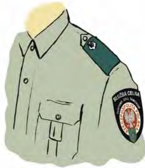
Nasuwka na pagon i sposób umieszczenia emblematu Służby Celnej