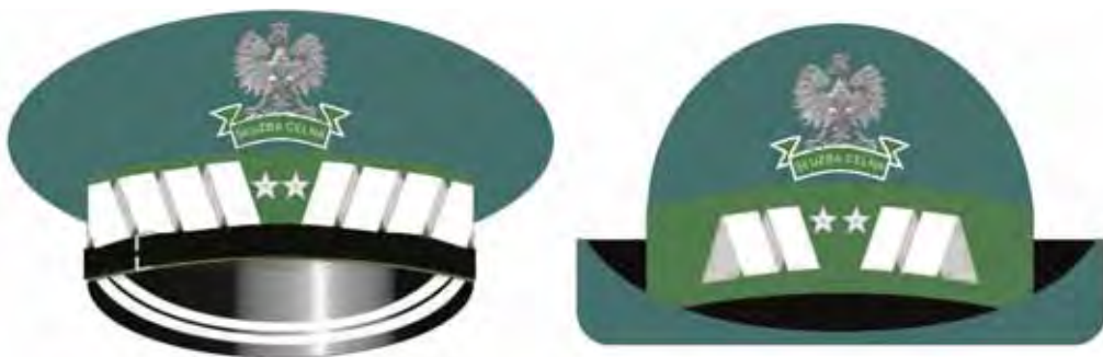
generał Służby Celnej