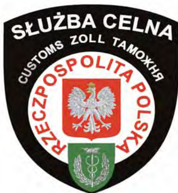
Emblemat Służby Celnej