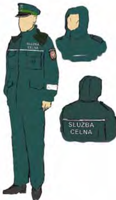
Funkcjonariusz w ubiorze służbowym, ubrany w kurtkę.