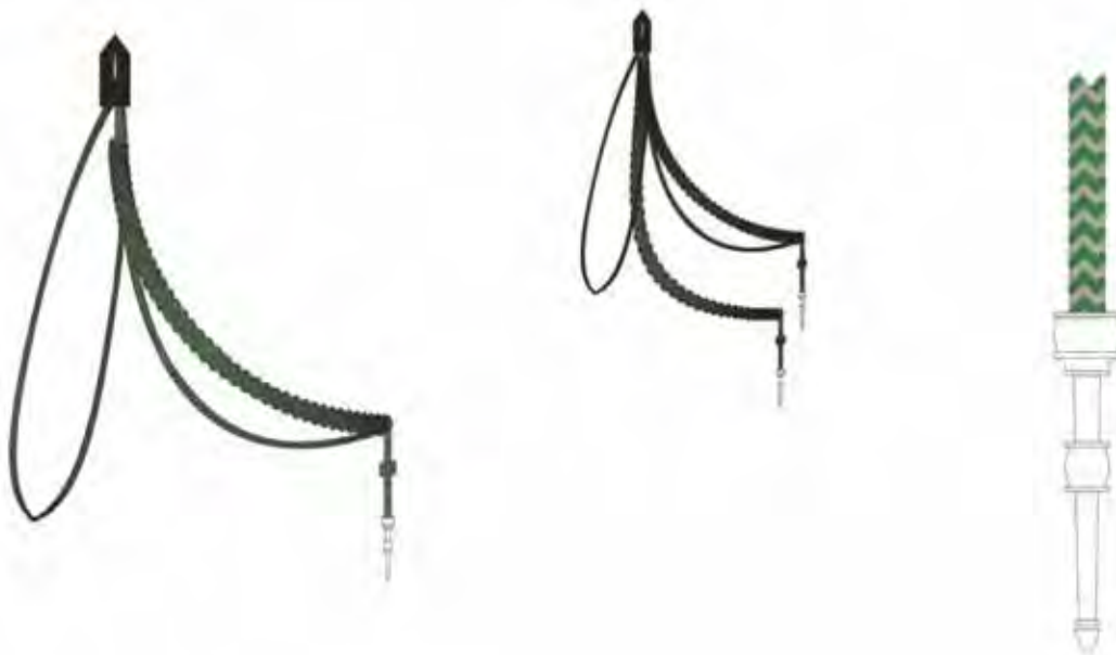
Sznur do ubioru służbowego ze splotem