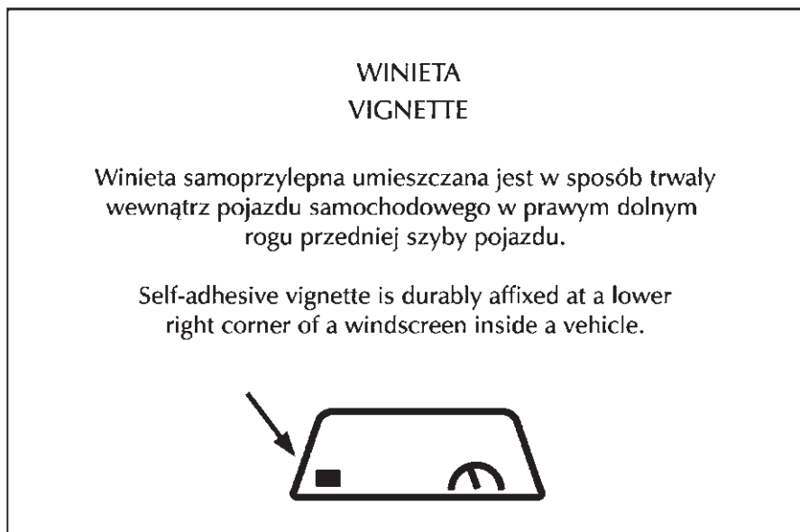
WINIETA — REWERS